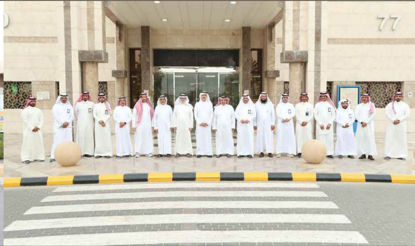
مجمع إرادة والصحة النفسية