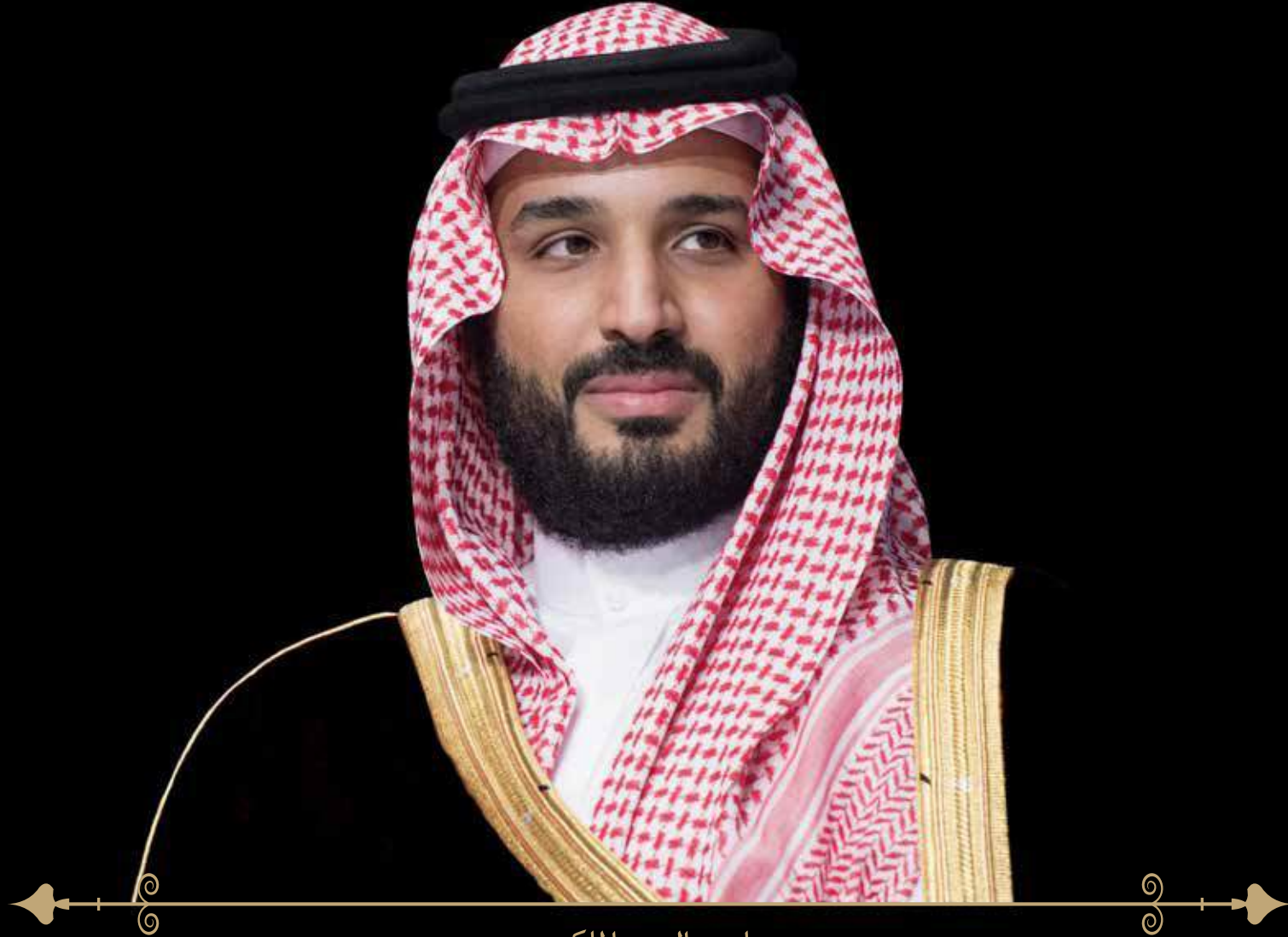
صاحب السمو الملكي

الأمير محمد بن سلمان بن عبدالعزيز آل سعود