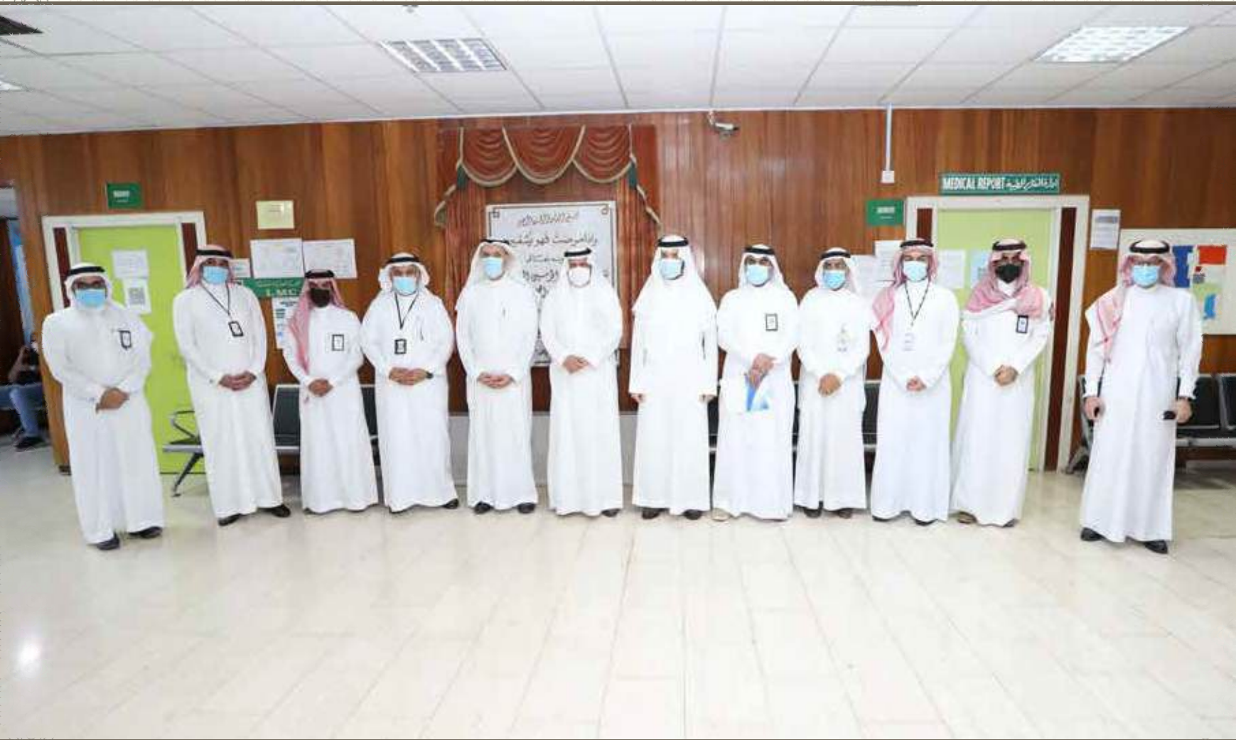
مستشفى القطيف المركزي