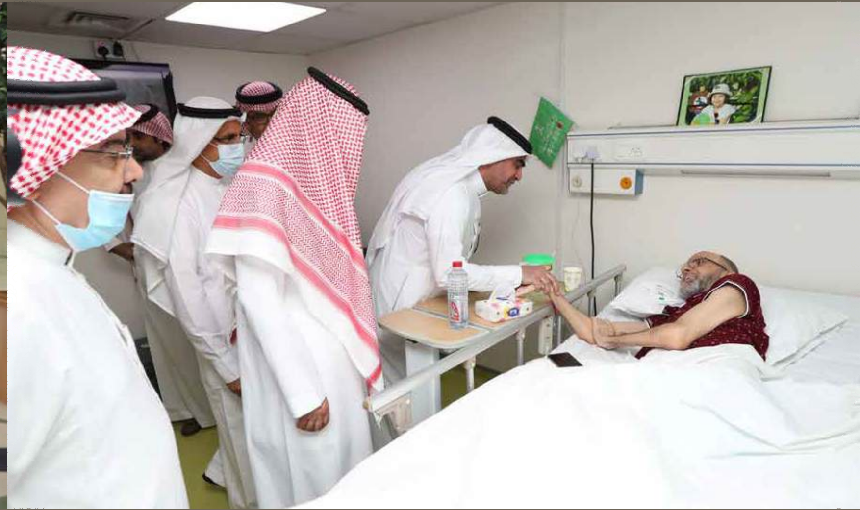
مستشفى الرعاية المديدة بالظهران