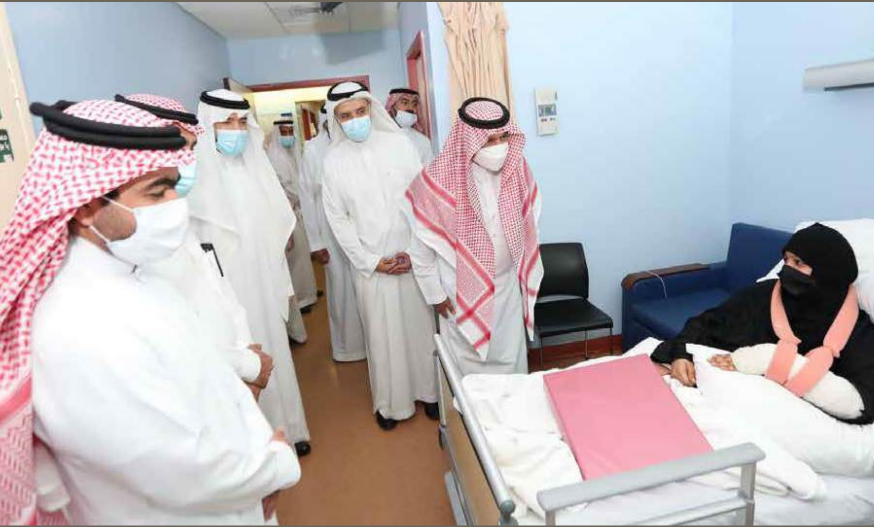
مستشفى الولادة والأطفال