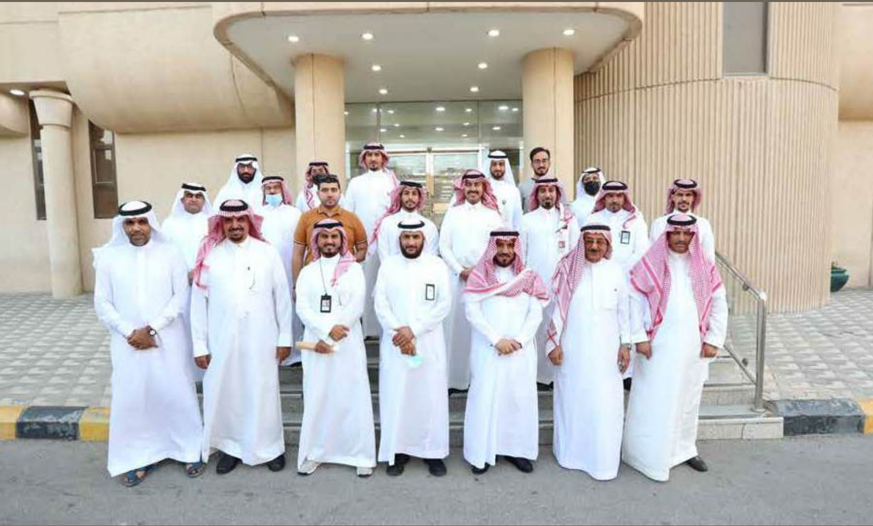
مستشفى الملك فهد الجامعي