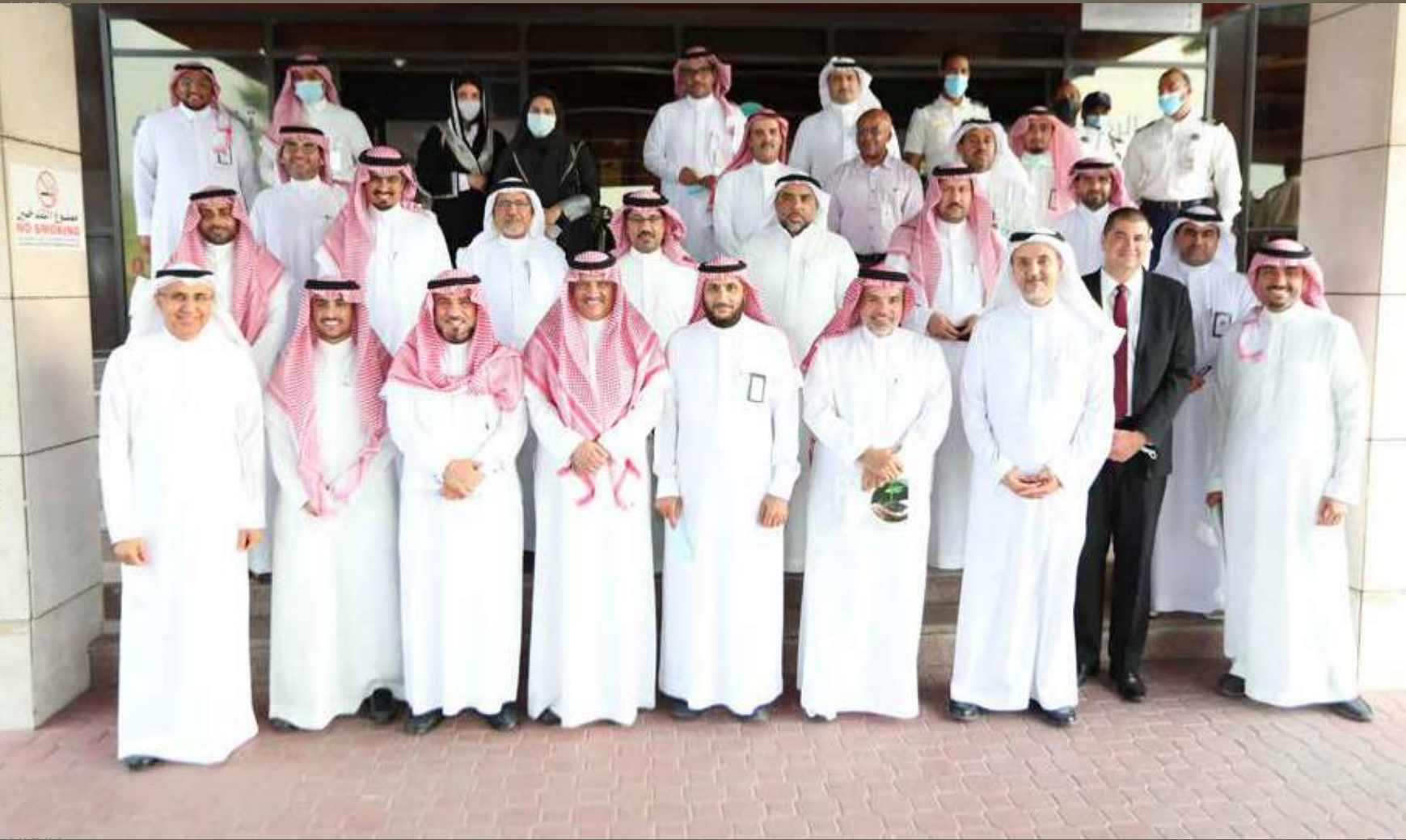
مستشفى الملك فهد التخصصي