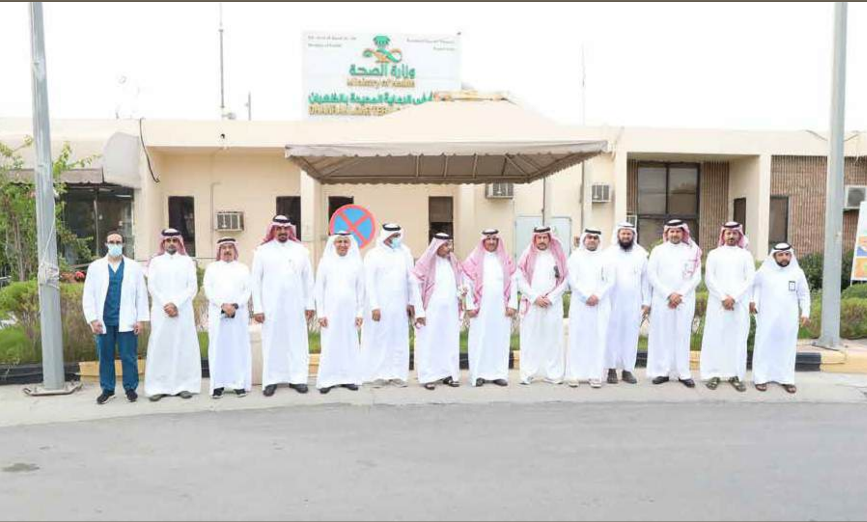
مستشفى الرعاية المديدة بالظهران