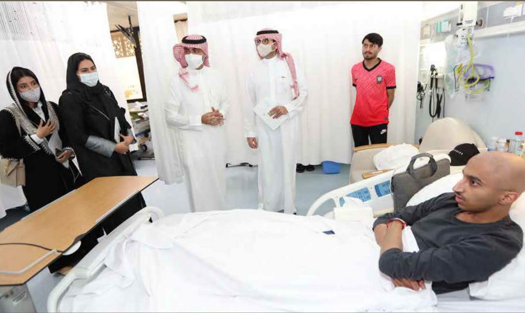
مستشفى الملك فهد التخصصي