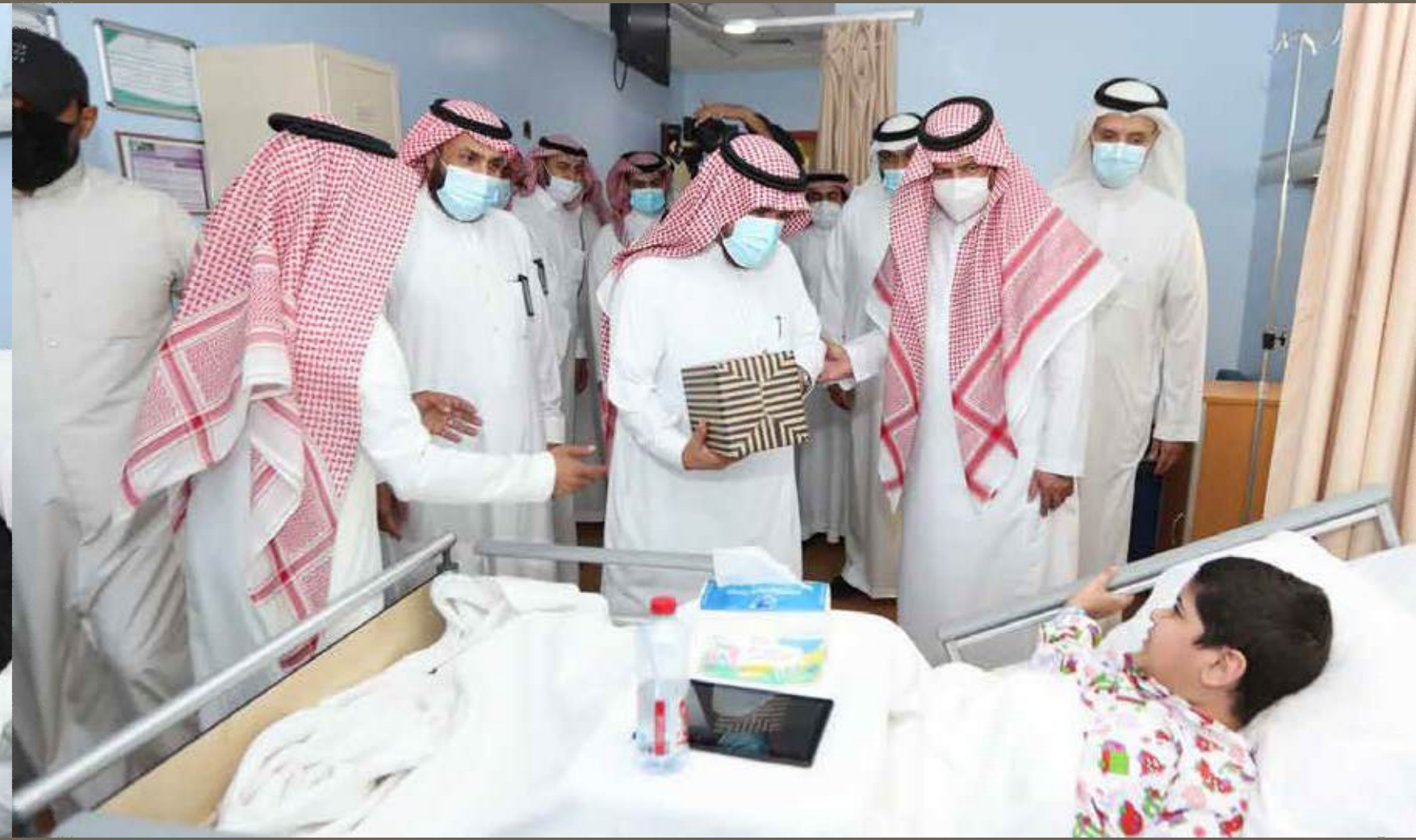
مستشفى الولادة والأطفال