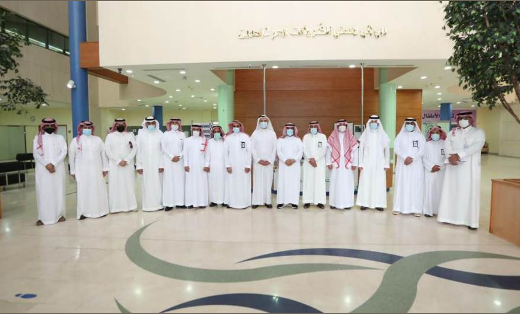
مستشفى الولادة والأطفال