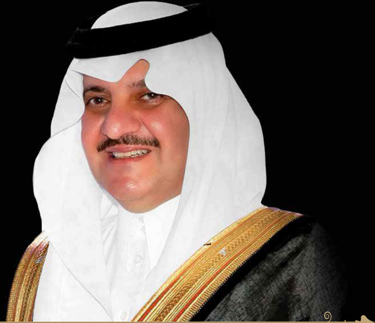
صاحب السمو الملكي الأمير

نائب أمير المنطقة الشرقية - نائب الرئيس الفخري لجمعية أصدقاء المرضى بالمنطقة الشرقية