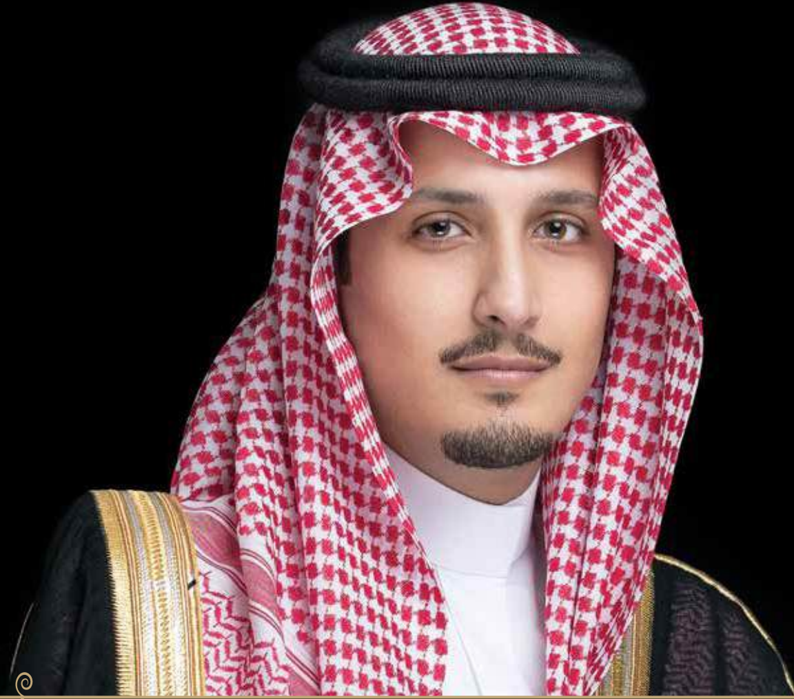
صاحب السمو الملكي الأمير