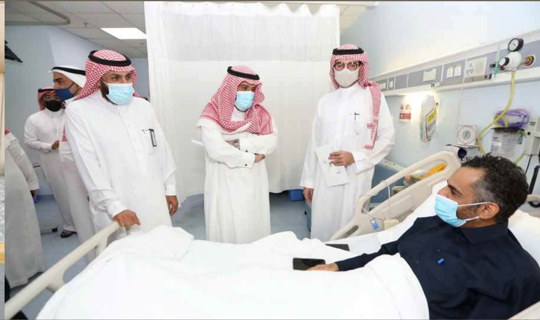
مستشفى الملك فهد الجامعي