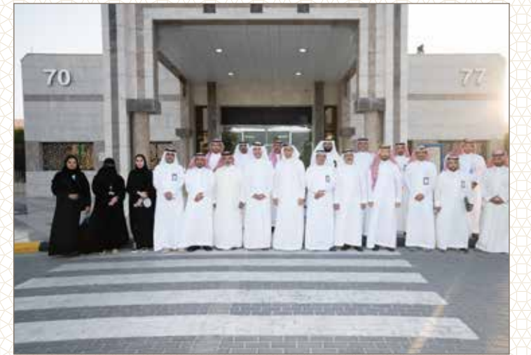
مستشفى الأمل للصحة النفسية بالدمام