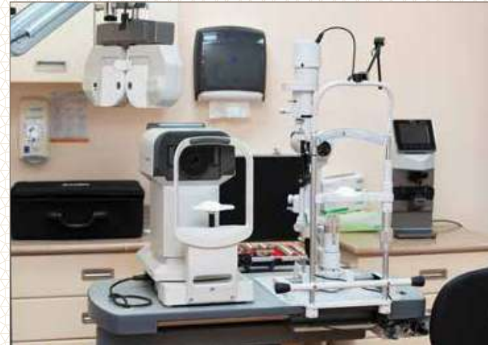
عيادة العيون - مستشفى الولادة والأطفال