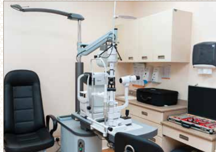
عيادة العيون - مستشفى الولادة والأطفال