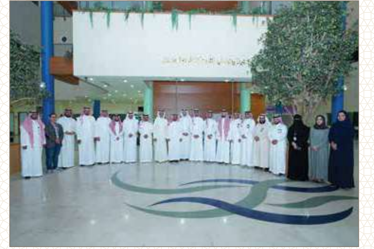
مستشفى الولادة والأطفال بالدمام