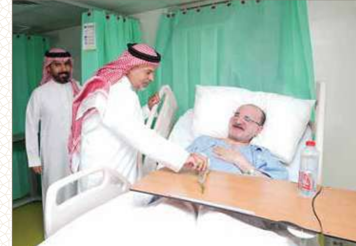
مستشفى الظهران العام