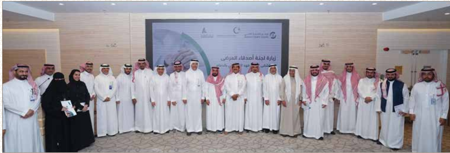
مستشفى الملك فهد التخصصي