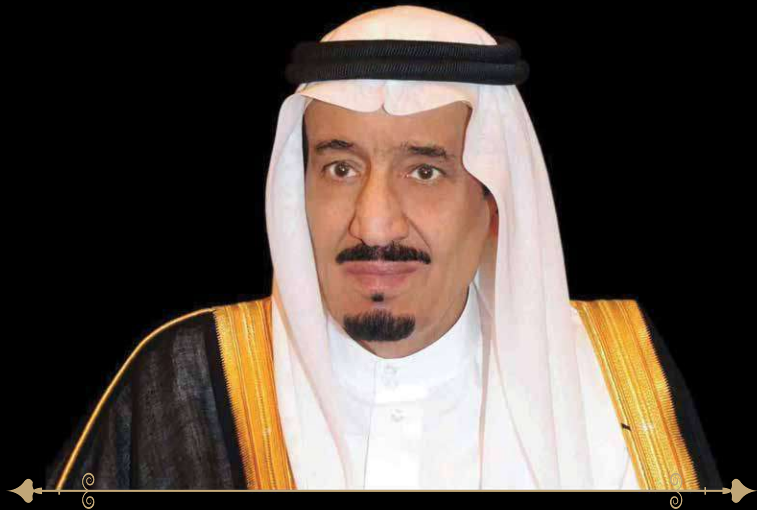
خادم الحرمين الشريفين الملك فيصل بن عبدالعزيز آل سعود