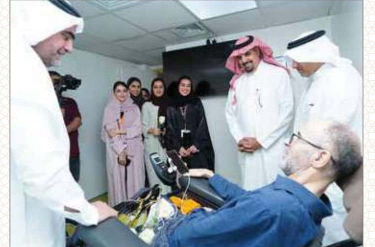
مستشفى الظهران العام