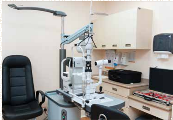
عيادة العيون - مستشفى الولادة والطفل