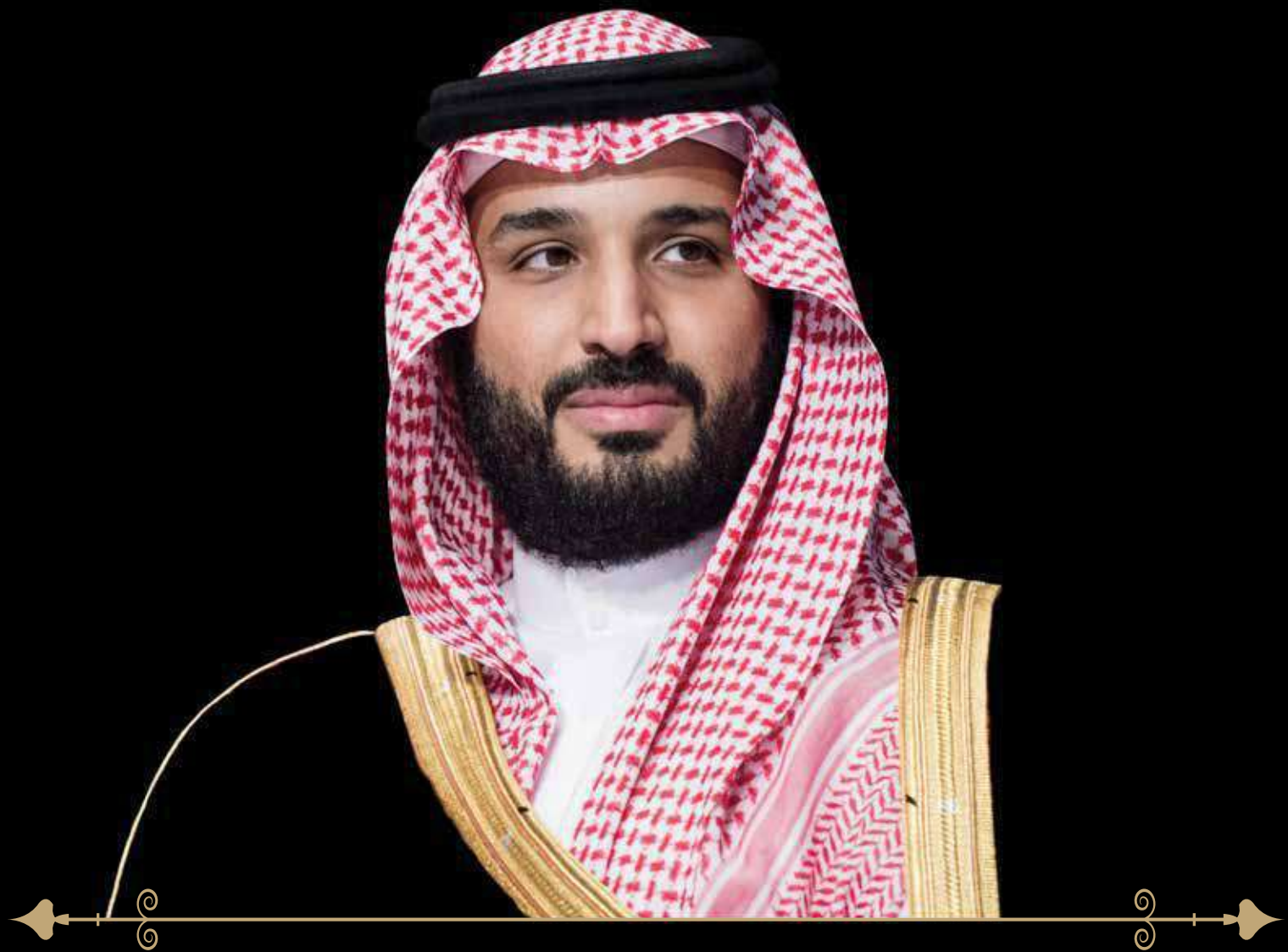
صاحب السمو الملكي الأمير محمد بن سلمان بن عبدالعزيز آل سعود ولي العهد رئيس مجلس الوزراء