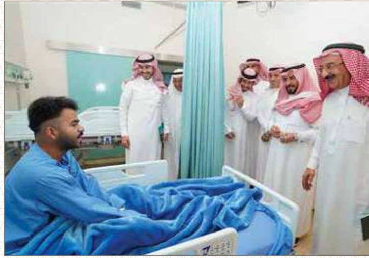
مستشفى الملك فهد الجامعي بالخبر