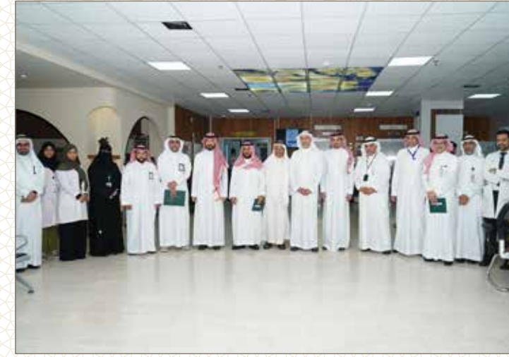
مستشفى القطيف المركزي