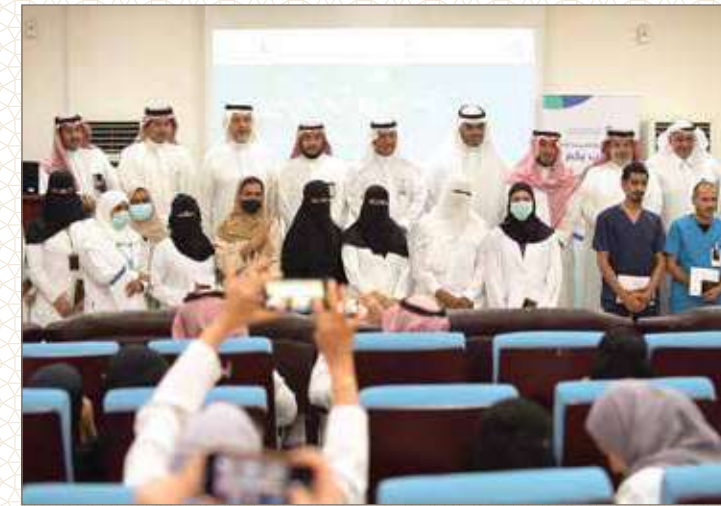
حفل تكريم الممارس الصحي