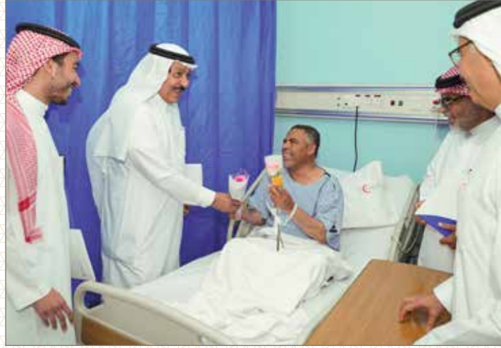
مجمع الدمام الطبي ( الدمام المركزي )