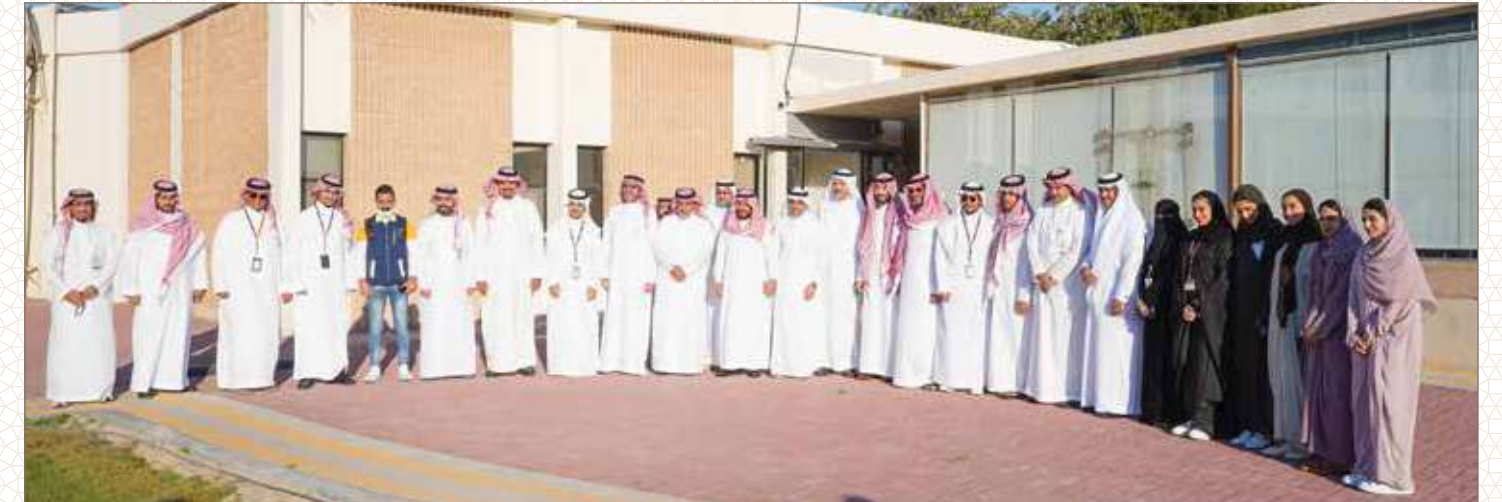
مستشفى الظهران العام